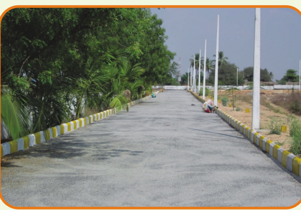
హైవే పార్క్ - బీబీ నగర్