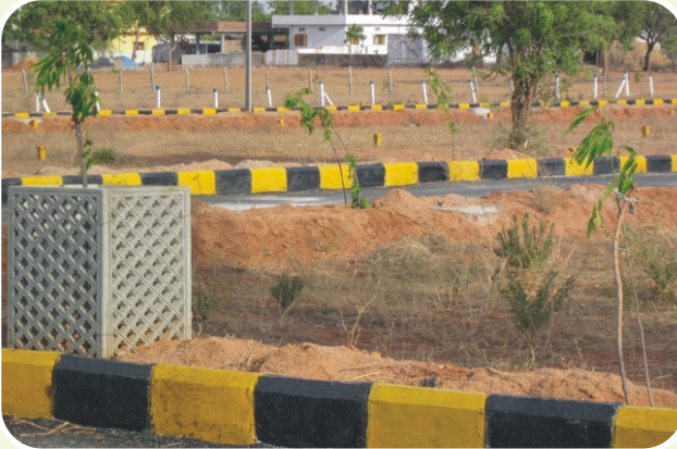
గ్రాండ్ సిటీ - ఘట్ కేసర్

కంపెనీ వారు పూర్తి చేసిన హైదరాబాద్ వెంచర్స్ రియల్ ఫోటోస్.