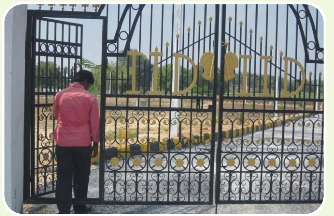
హైవే విల్లాస్ - అవుషాపూర్