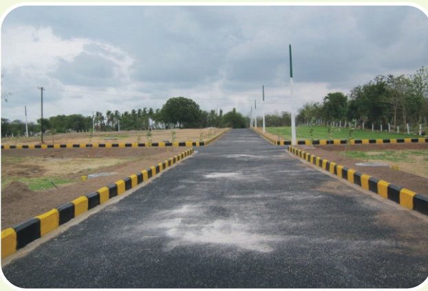
హైవే టౌన్ - అవుషాపూర్