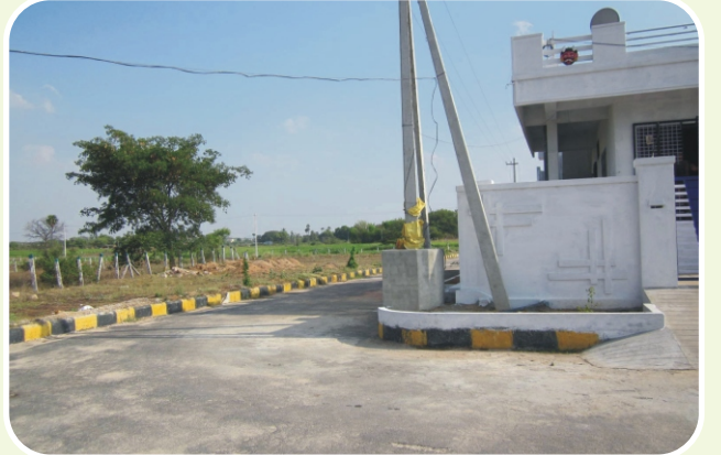
మెట్రో గ్రాండ్ సిటీ - ఘట్ కేసర్