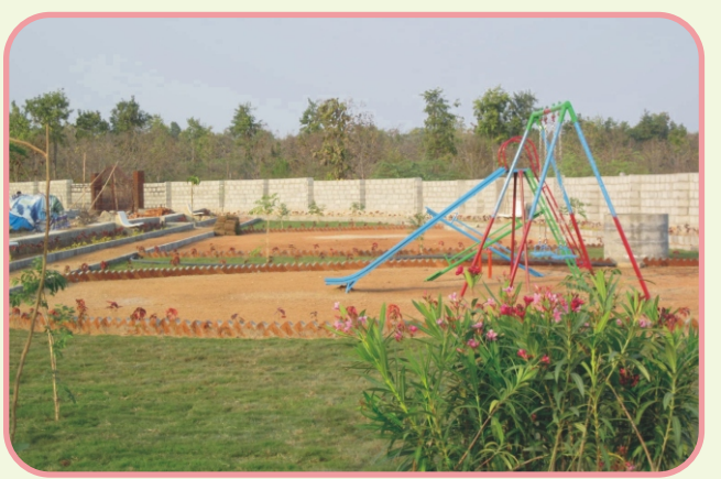
హైవే పార్క్ - బీబీ నగర్